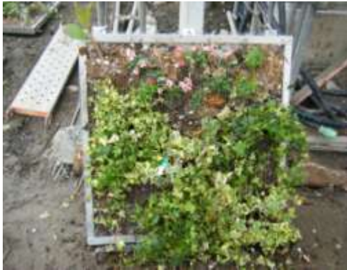
植栽を植えつける